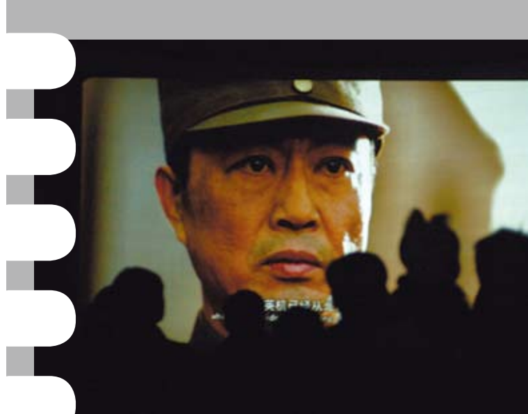
在農村的家門口就能看到和大城市同時上映的電影，提升了農村的休閒文化品質。