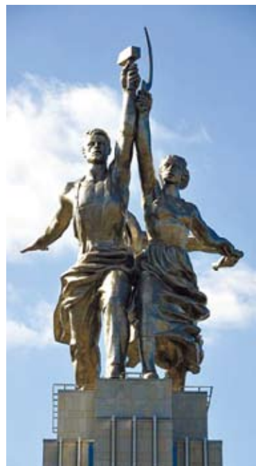
《工人與集體農莊女莊員》，薇拉·穆欣娜，1937，不鏽鋼。

今佔據舞台要津的主角、配角，以及眼花瞭亂的跑龍套，它們的色彩繽紛琳琅滿目，偏偏令人反胃膩煩說不出口的兩色，瞞它們眼皮立刻發麻，卻又不能假裝視而不見，它們當是台上舞動生姿的阿Q，在島之邏輯的範圍裡吾人合該是台下傻乎乎的阿Q，雙Q一斑。