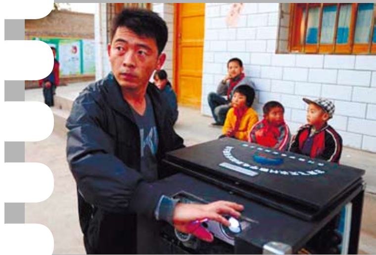
在甘肅省一個農村裡，放映人正準備為村民播放電影。